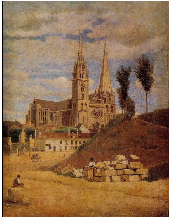
Jean-Baptiste Camille Corot, Katedra w Chartres , 1830, olej na płótnie, Luwr, Paryż