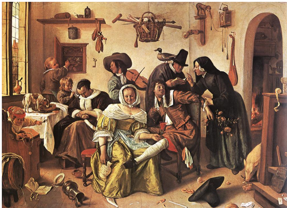
Jan Steen, Zwariowane gospodarstwo , 1663 r., olej na płótnie, 105 x 145 cm, Kunsthistorisches Museum , Wiedeń